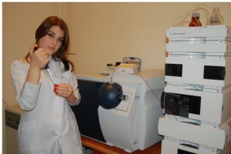
LC-MS xrommasspektrometri Dəyəri 270 000 avro